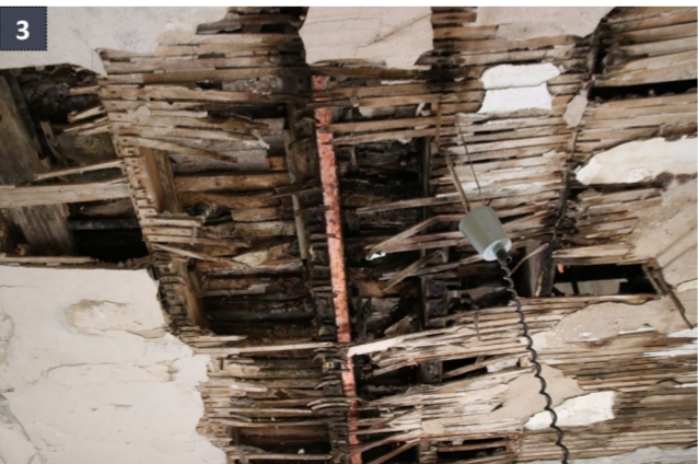
29 aprile 2019