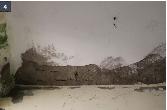
29 aprile 2019