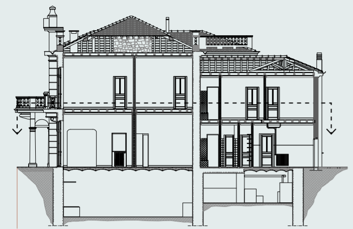
TIPOLOGIA DEI SOLAI