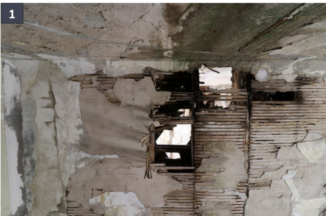
29 aprile 2019