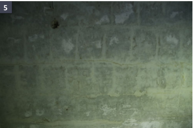
29 aprile 2019