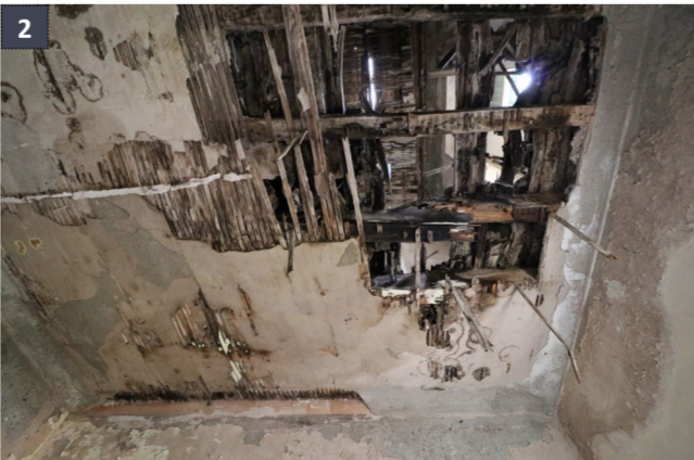
29 aprile 2019